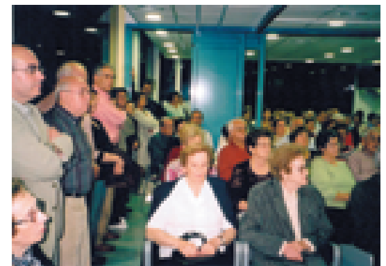
Presentació del llibre a Blanes.