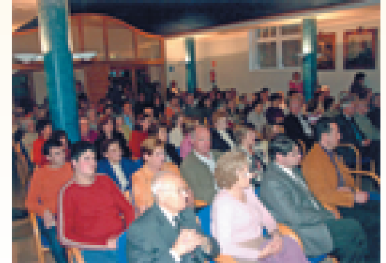
Presentació del llibre a Olot.

• Molt agraïda, Lliberada, dels teus favors. Anònim (Des'07)